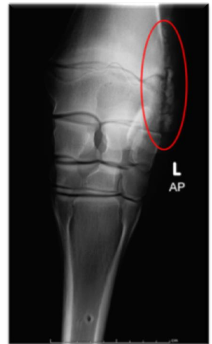
תמונה 1: עדות לזיהום גרמי (osteomyelitis) עם סימני פירוק (ליזיס) ושגשוג של עצם. הנזק הגרמי נמצא באספקט הלטרלי של המפרק הרדיו-קרפלי, המערב בעיקר את הרדיוס הדיסטלי (מסומן במעגל אדום)

במהלך האשפוז זוהתה נשימה מהירה ומאומצת ועל כן בוצעו צילומי רנטגן לבית החזה בהם נראה חשד לדלקת ריאות קלה (אטימות באספקט הקאודו ונטרלי של הלב, חמור מעט יותר בריאה ימין- תמונה 3), ככל הנראה בשל שאיפת תוכן קיבה בעת ההרדמה. על כן, הוחלט על הוספת כיסוי אנטיביוטי נוסף כנגד חיידקים אנארוביים (מטרונידזול). לאחר מספר ימים הנשימה השתפרה ושבה לתחום הנורמלי.