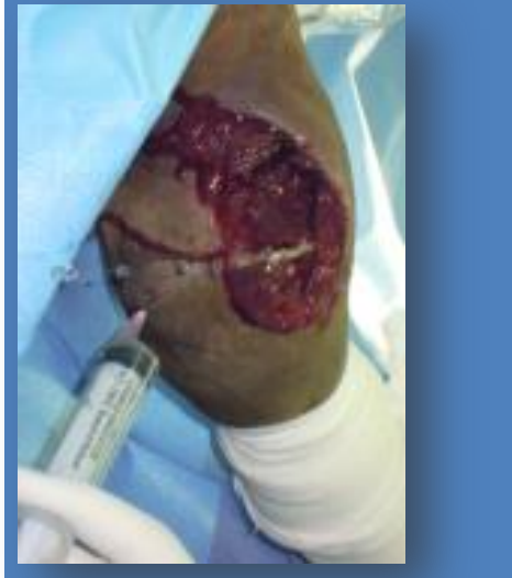
תמונה 2: הפצע של הסייחה, במהלך ניתוח אקטרוסקופיה

במהלך הניתוח, ולמשך 13 ימים לאחר מכן, בוצעו טיפולים אנטיביוטיים אזוריים (Ceftriaxone RLP). בנוסף, טקילה טופלה באנטיביוטיקה סיסטמית רחבת טווח (כלורמפניקול), בשיכוך כאב (פניל בוטאזון ובופרנורפין) ובמגיני מערכת עיכול (אומפרזול).